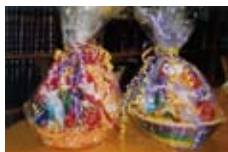
Regalos para los amigos