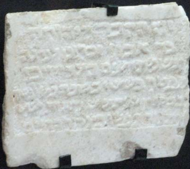
Lápida de Córdoba (S.IX) Epitafio de Yehudá

“Ésta es la sepultura de Yehudah Bar Akon de bendita memoria Sea su espíritu con los justos Murió el día sexto de la semana, día tres del mes de Kislev del año [4]606 Descanse su alma en el haz de los vivientes”