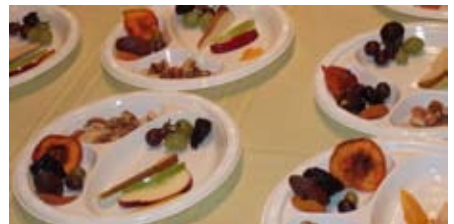
Frutos de diversos arboles.

En distintos círculos tradicionales, se reúnen el 15 de Shevat y se realiza un acto en el que se leen pasajes bíblicos relacionados con los árboles y la naturaleza. Se recitan bendiciones especiales y se comen frutos de diversos árboles. Los judíos de Haredi llaman el día por su nombre completo original, Jamishah Asar BeShevat - El decimoquinto de Shevat.