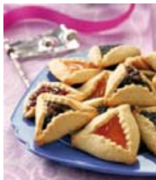
Dulces especiales "Orejas de aman"