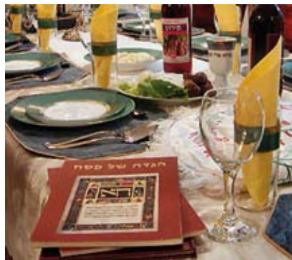
Fiesta del Pésaj.