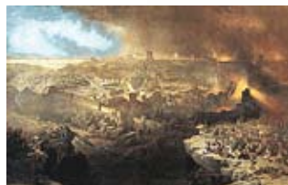
Ilustraciones que muestran el desastre.