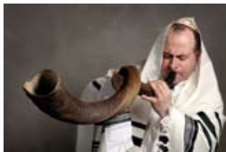
El "Shofar" es tocado durante la plegaria matutina

Rosh Hashaná es el Año Nuevo espiritual judío y se celebra el primero y el segundo día de Tishrei.