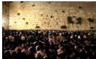
Muro de las lamentaciones.