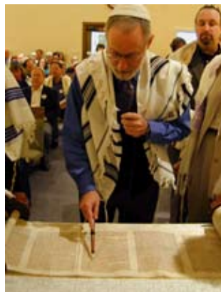
Lectura de la Torá.