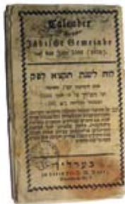
El "Calendario de la comunidad judía alemana" para el año 5591 (1831), que incluía "todas las festividades, ayunos y plegarias, así como las ferias de los estados de Brandeburgo y Silesia" - Berlín, 1831