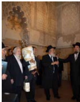
Baile de la Torá en la Sinagoga de Córdoba