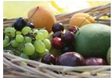
Cesta de frutas del Shavuot