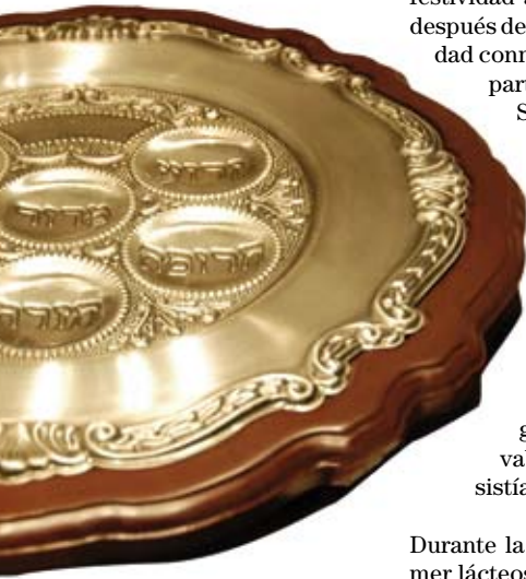
Plato de Pésaj

Además de las fuentes bíblicas que dieron origen a la festividad tenemos fuentes talmúdicas, el tratado de bikurim realiza una minuciosa descripción de la elección de las primicias, de los frutos de los árboles y cómo eran llevados a Jerusalem. Los saludos, el colorido y la alegría reinante que acompañaba a este magno acontecimiento.