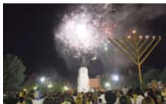
Fiestas con motivo de la .