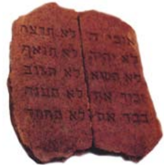
Tablas de la Ley