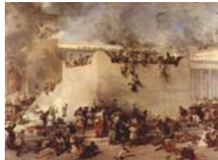
Ilustraciones que muestran el desastre.

Muchas otras calamidades históricas que le ocurrieron al pueblo judío en su larga historia ocurrieron el 9 de AB. Los últimos días para abandonar la España inquisitorial, en 1492, coinciden con esta fecha nefasta. El atentado a la AMIA, en Buenos Aires, el 18 de Julio de 1994, fue el 10 de AB en el calendario hebreo, coincidiendo otra vez con días de muerte y destrucción. Hasta los días de la SHOÁ, el holocausto, donde fueron masacrados seis millones de judíos, el 9 de AB era el día más triste de la historia judía.