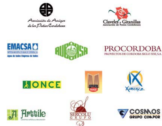
puntero@amo D.L.: 449-2009