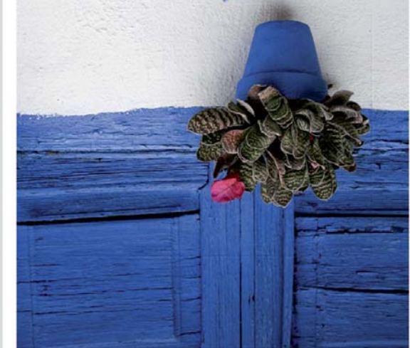
2º premio Concurso de Fotografía en los Patios 2008. Autor: Monserrat Gámez Castillo. Marruecos nº 6